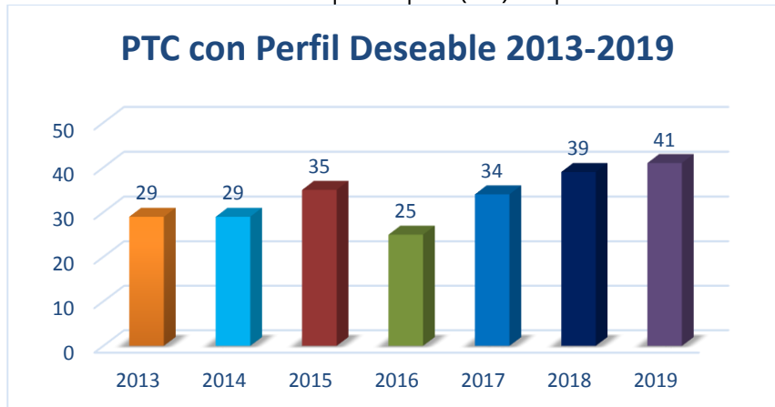
Evolución de los Profesores de Tiempo Completo (PTC) con perfil deseable 2013-2019

Fuente: Departamento de Gestión Académica, UNISTMO 2019.